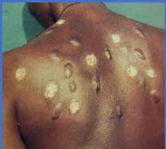
Mabaka na vivimbe/vinundu