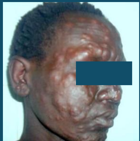
Vivimbe vya usoni