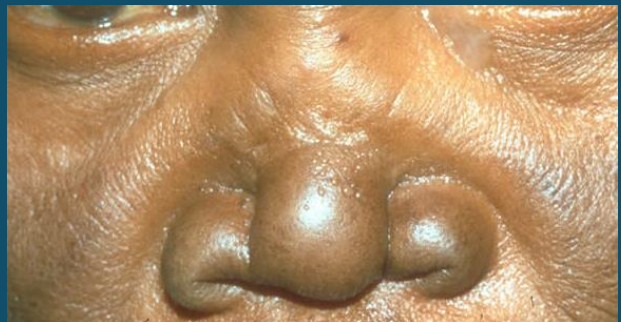
Pua iliyoharibika muonekano