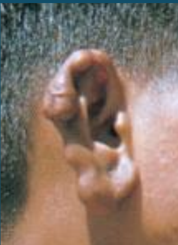
Masikio yaliyoharibia/ vivimbe